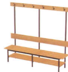
Banco para Vestiário