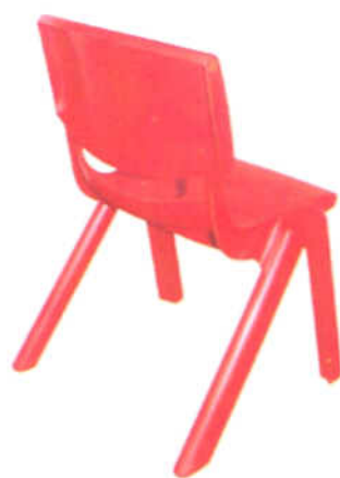
Cadeira em Polipropileno ▲

Estofos em espuma de alta densidade com revestimento a tecido ou napa.