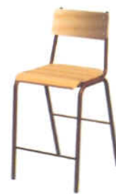
Cadeira para Estirador