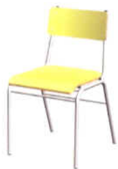
Cadeira para Refeitório