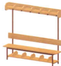
Banco para Vestiário