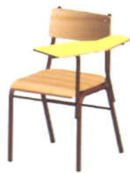
Cadeira c/ Superf. de Escrita