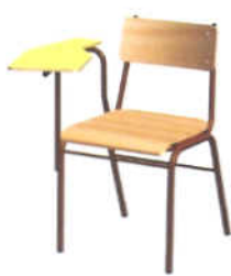
Cadeira c/ Superf. de Escrita